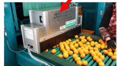
柑橘選果場での活用事例