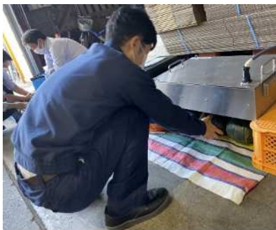
iR フレッシュの照射処理

照射区と未照射区の異常果の発生数を計測し、1週間ごとの商品ロス率を比較しました。