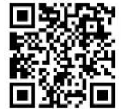
水田 farmo 紹介動画